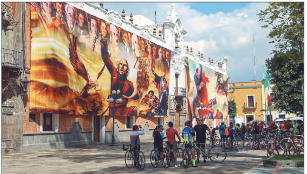
La fachada de Palacio de Gobierno de Tlaxcala fue adornada con impresiones en gran formato de imágenes alusivas al 203 aniversario del inicio del movimiento de independencia de México

ENOE reveló que se integraron 18 mil 90 personas a la informalidad laboral en los últimos 12 meses en la entidad: Inegi