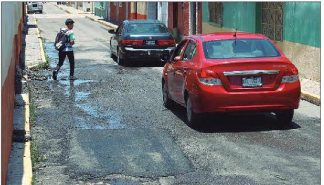
Las fuertes precipitaciones pluviales del fin de semana ocasionaron daños en diversos puntos de la capital tlaxcalteca, los cuales fueron atendidos por la autoridad municipal en las zonas donde fueron más severas las afectaciones, como el alfallo en varias calles

Será de 6 meses plazo de no haber ocupado cargo público previo a dirigir el OFS; el Congreso ya tiene listo dictamen de reforma