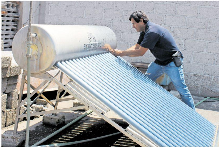
Además de generar un ahorro, usar calentador solar equivale a sembrar miles de árboles al año