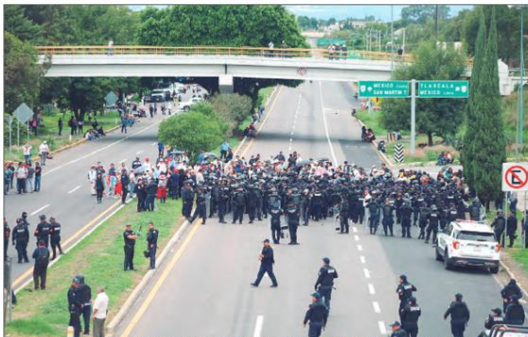
Agremiados del Sindicato 7 de Mayo bloquearon el tránsito en la autopista Tlaxcala-San Martín Texmelucan desde las 11 horas de este lunes, sin importarles la afectación a terceros que no pudieron continuar con su recorrido o tuvieron que caminar para llegar a sus destinos

■ Mantiene gobierno del estado mesas de diálogo e información permanente con representantes sindicales