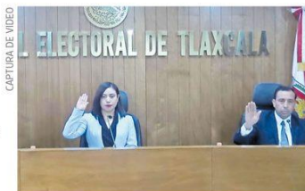
CAPTURA DE VIDEO

En sesión ordinaria del pasado lunes, el Pleno del Tribunal Electoral de Tlaxcala (TET) confirmó las resoluciones del Instituto Tlaxcalteca de Elecciones (ITE) de no otorgarles el registro como partido político a las agrupaciones ciudadanas "Unificación y evolución", "Espacio democrático de Tlaxcala", "Sociedad independiente sí", "Encuentro solidario A.C." y "Renovemos Tlaxcala A.C.". Pág. 6