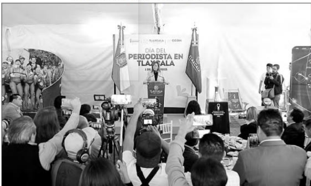
La gobernadora Lorena Cuéllar expuso que el gremio periodístico es pieza fundamental para difundir las actividades del Poder Ejecutivo local, asimismo, le ofreció respeto y le pidió conducirse con credibilidad