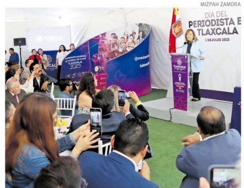
La Gobernadora refrendó su respaldo y apoyo a los periodistas