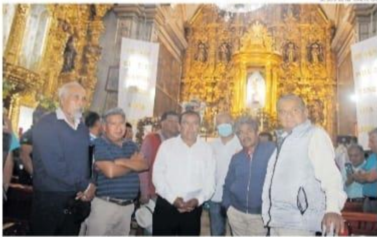
Feligreses y mayordomos se mantienen firmes en su postura en contra del párroco